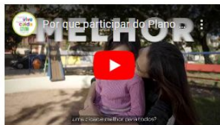
Por que participar do plano diretor