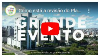
Como está a revisão do plano diretor?