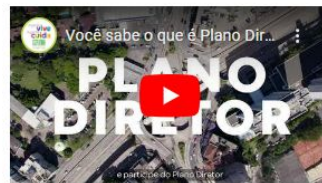
Você sabe o que é plano diretor?