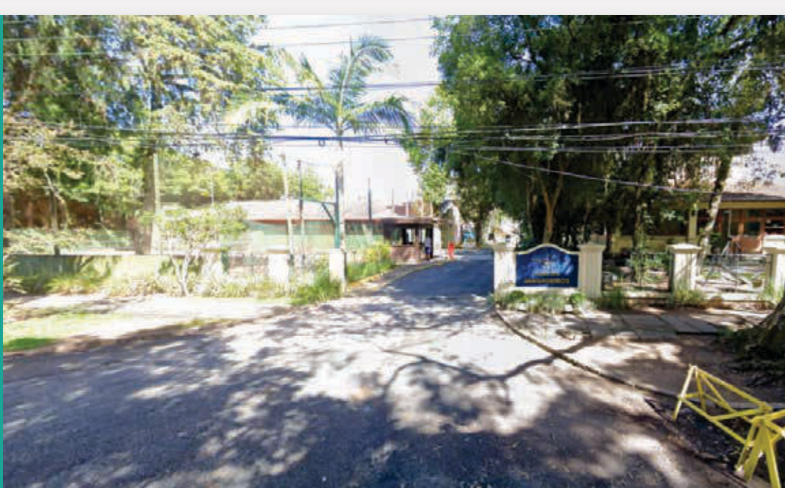
Clube dos Jangadeiros | RGP 6