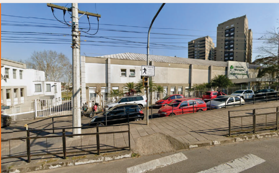
Hospital Independência | RGP 4