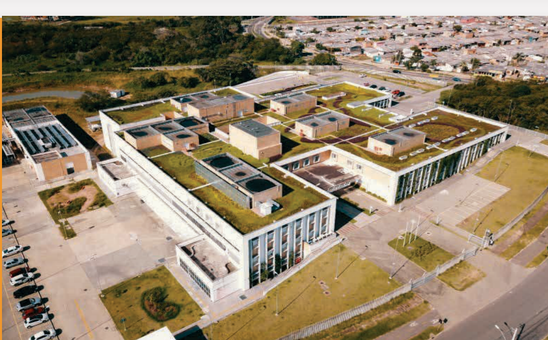
Hospital da Restinga e Extremo Sul | RGP 8