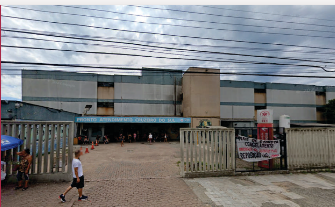
Postão da Cruzeiro | RGP 5