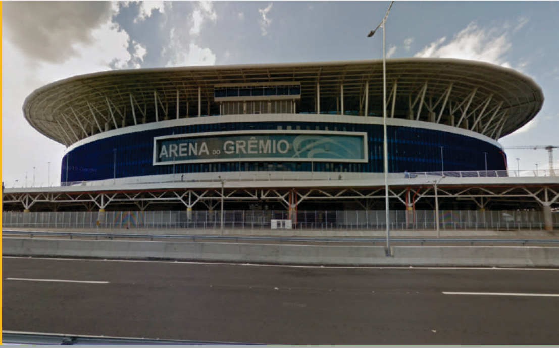
Arena do Grêmio | RGP 2