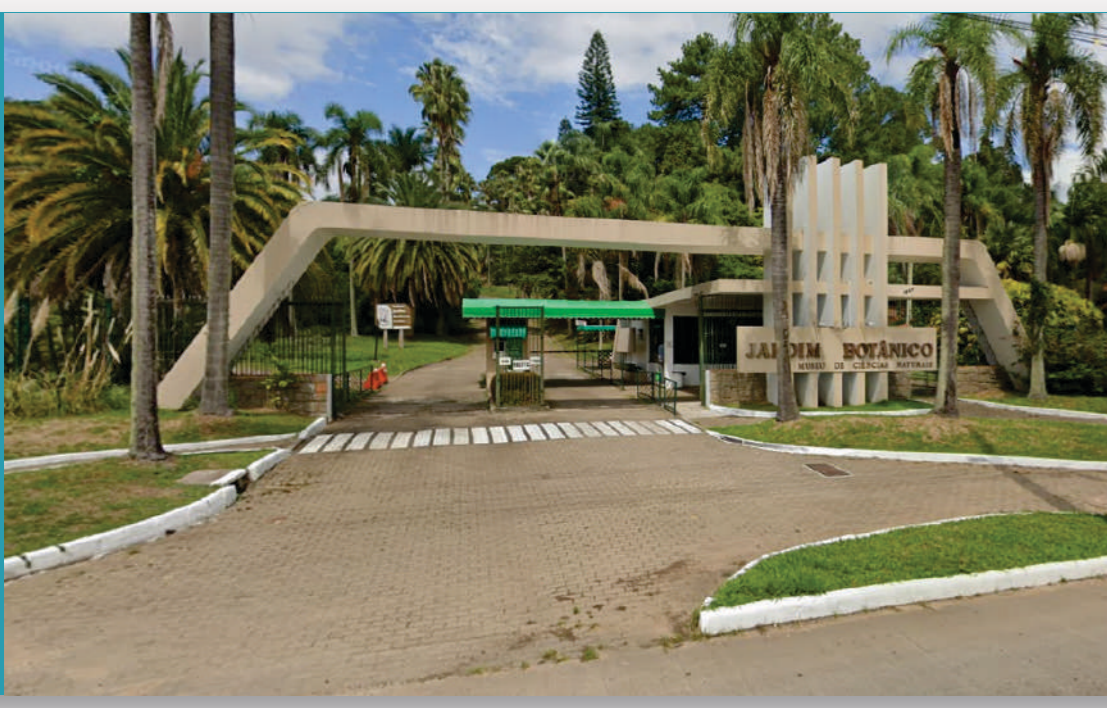
Jardim Botânico | RGP 1