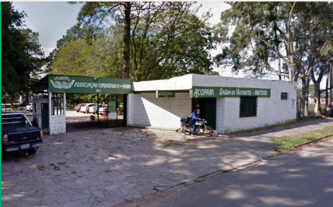
Associação Comunitária do Parque dos Maias | RGP 3