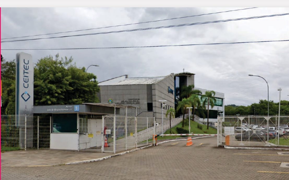
CEITEC | RGP 7