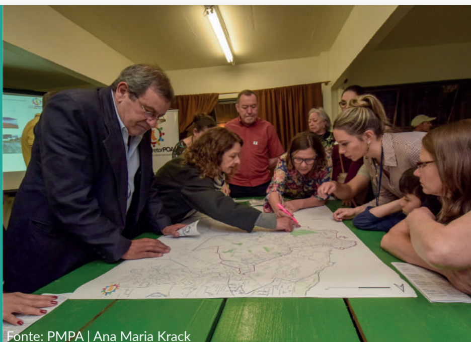
Oficina realizada em 23/10/2019

Acesse o relat rio na  ntegra no site do Plano Diretor, atrav s do QR CODE: