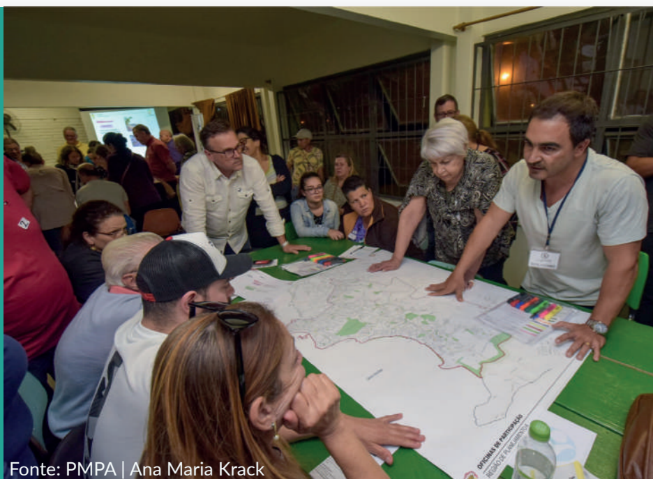
Oficina realizada em 23/10/2019

Os grupos foram divididos em 4 (quatro) mesas de acordo com os n meros recebidos pelos participantes no momento do credenciamento, depois redistribu os em 3 (tr s) para melhor desenvolvimento do trabalho. Em cada grupo participaram 2 (dois) integrantes da CPU como moderadores/relatores. Cada grupo recebeu um mapa base da RGP e canetas marca texto coloridas e foram orientados a fazer marca o no mapa de acordo com cada tema. De acordo com as listas de presen a participaram 111 pessoas da comunidade, 09 t cnicos da CPU, al m de 14 servidores vinculados a SMAMS.