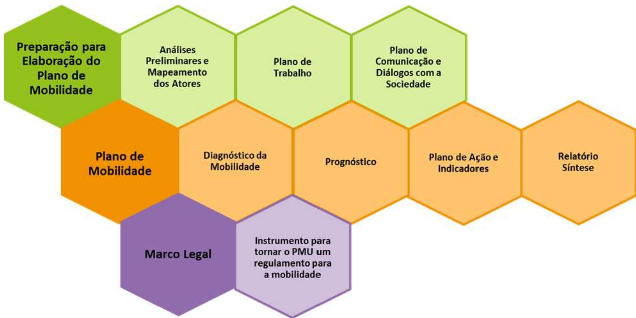
Figura 4– Produtos do Plano de Mobilidade de Porto Alegre

Os relatórios a serem entregues estão divididos de acordo com o roteiro em três grandes grupos: Preparação para elaboração do Plano de Mobilidade, Plano de Mobilidade e Marco Legal (Figura 4).