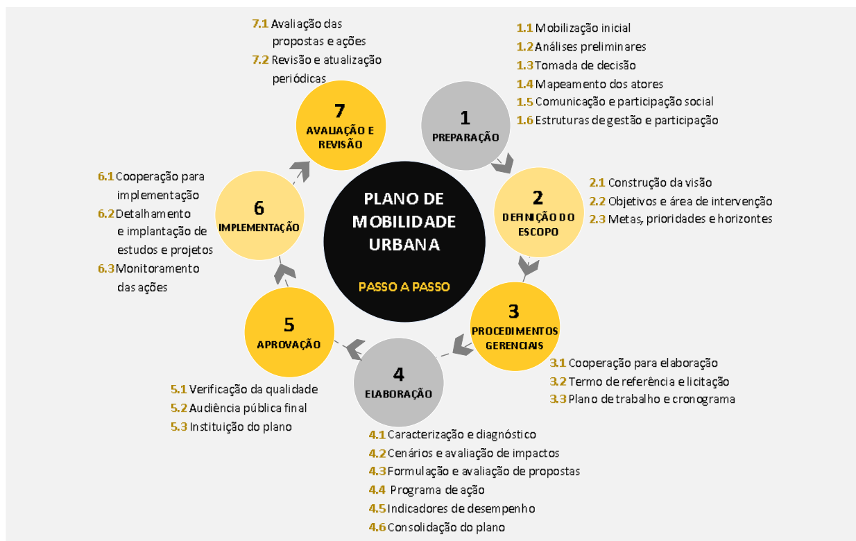
Figura 2 – Passo a passo para um Plano de Mobilidade Urbana – WRI Brasil

A metodologia consiste em sete passos: (i) preparação, (ii) definição do escopo, (iii) procedimentos gerenciais, (iv) elaboração, (v) aprovação, (vi) implementação e (vii) avaliação e revisão. Os passos foram complementados e detalhados por meio de um conjunto de 26 atividades (Figura 2). Cada uma delas conta com uma descrição dos aspectos necessários para a sua execução e dos resultados esperados, com destaque para questões importantes e evitáveis.