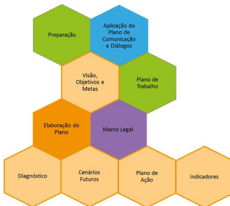
Figura 1– Roteiro básico para construção do PMU em Porto Alegre.

Para elaboração de seu Plano de Mobilidade Urbana, Porto Alegre conta a metodologia Sete Passos – Como Construir um Plano de Mobilidade , que foi desenvolvida pelo WRI Brasil. A partir dessa metodologia, foi estruturado um roteiro básico que será utilizado como referência para elaboração do Plano de Mobilidade em Porto Alegre (Figura 1). Este roteiro engloba atividades de preparação, aplicação do plano de comunicação e diálogos, elaboração do plano, marco legal, plano de trabalho, diagnóstico, cenários futuros, plano de ação e indicadores.