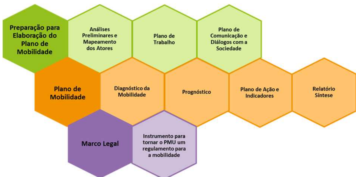
Figura 1– Relatórios do PMU em Porto Alegre

O presente documento refere-se à etapa Preparação para Elaboração do Plano de Mobilidade. Neste relatório será apresentado o Plano de Comunicação e Diálogos com a Sociedade, esclarecendo as atividades de comunicação, diálogos e relacionamento propostas, bem como o cronograma do processo.