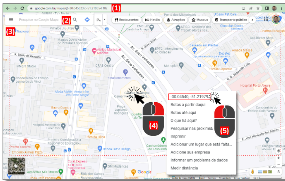
Figura 1: Roteiro para a captura de coordenadas na interface do Google Maps

NOTA: Garantir que a aproximação em tela antes da coleta da coordenada seja suficientemente próxima para garantir a localização exata do local de interesse.