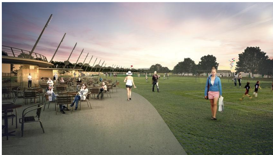
FIGURA 5.1.2.1.1 – REPRESENTAÇÃO GRÁFICA DOS BARES DO TRECHO 3

Fonte: Projeto Parque Orla do Guaíba – Trecho 3/Jaime Lerner e Associados