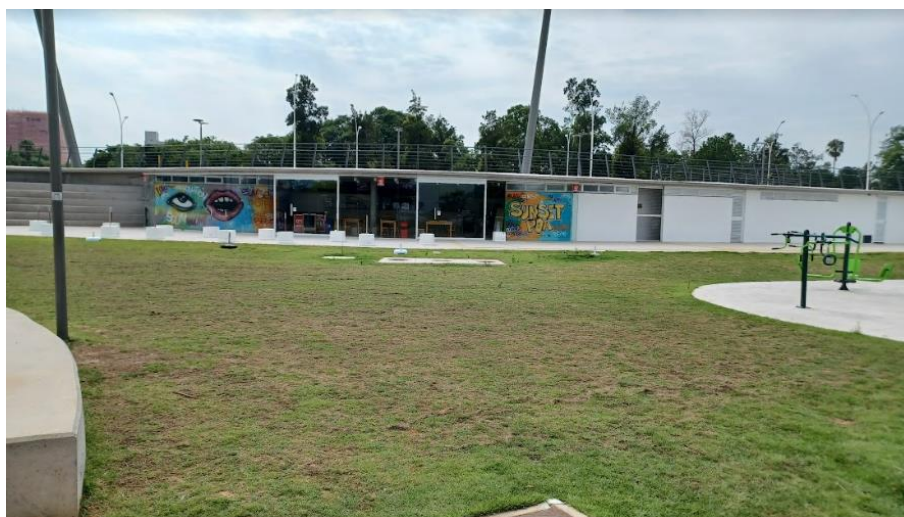
FIGURA 5.1.2.1.2 – ÁREAS DOS BARES ATUALMENTE