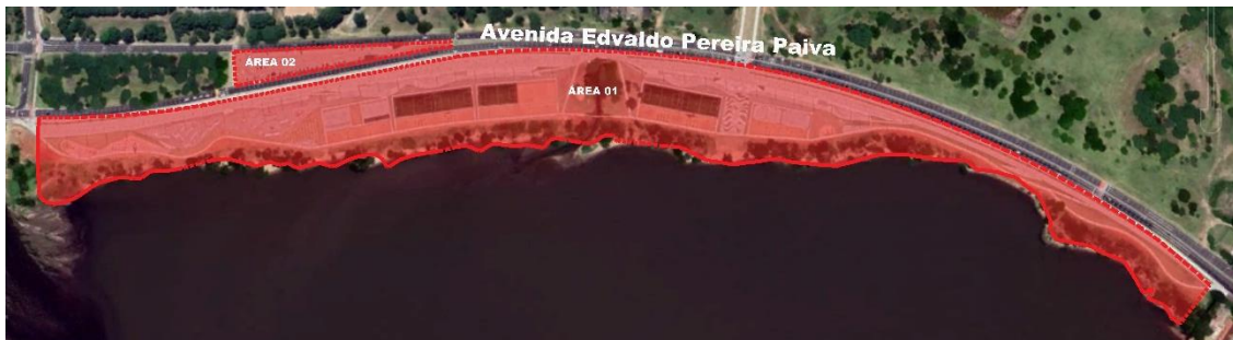
FIGURA 3.2 – MAPA DE ÁREA DE CONCESSÃO DO PARQUE ORLA DO GUAÍBA – TRECHO 3