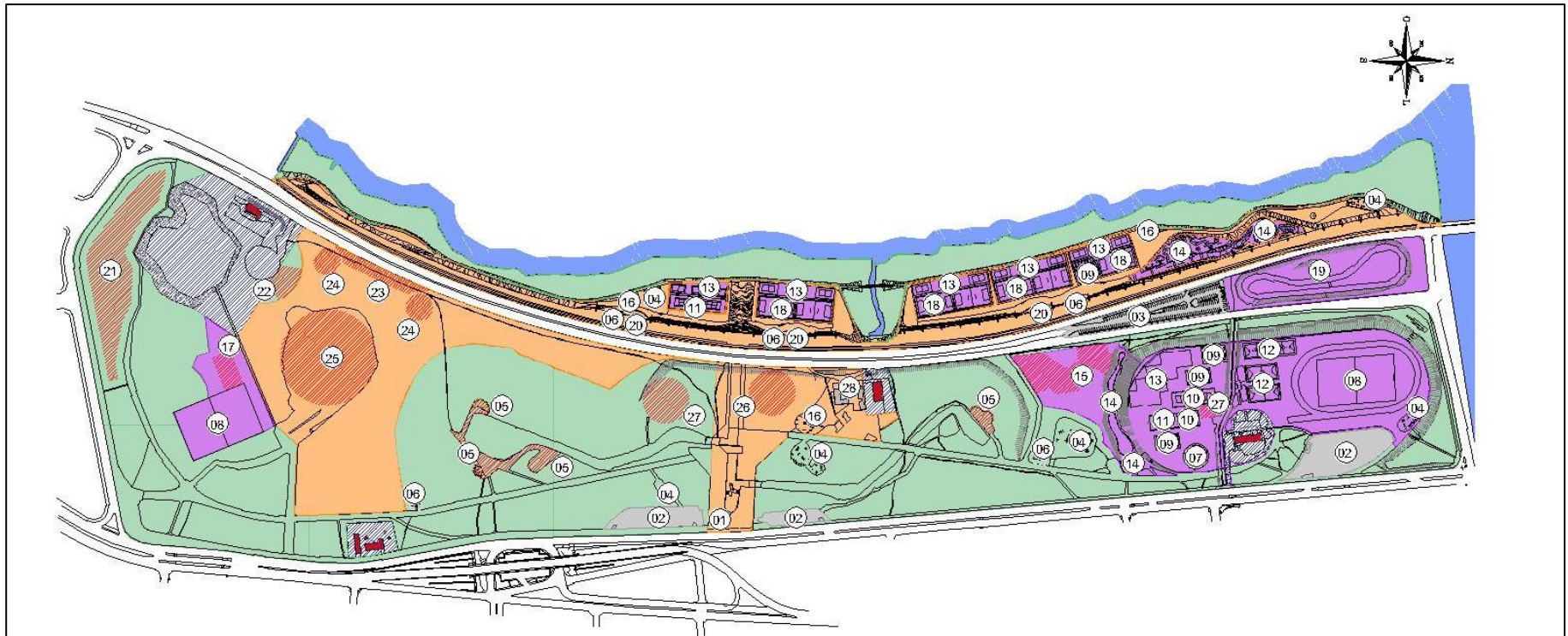
IMPLANTAÇÃO - SETORIZAÇÃO PARQUE MARINHA DO BRASIL E ORLA DO GUÁIBA (TRECHO 3) Escala: 1:2500