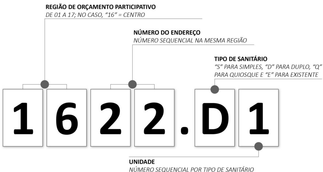
Figura 2 – Racional de Identificação do Código Preliminar, tomando como exemplo uma única unidade de MÓDULO DUPLO localizado na Região 16 – Centro, na Praça Piratini (endereço 22).