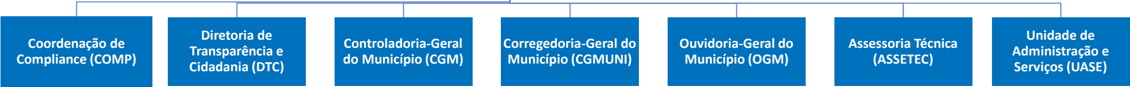
Organograma conforme Decreto nº 21.333 de 19/01/2022